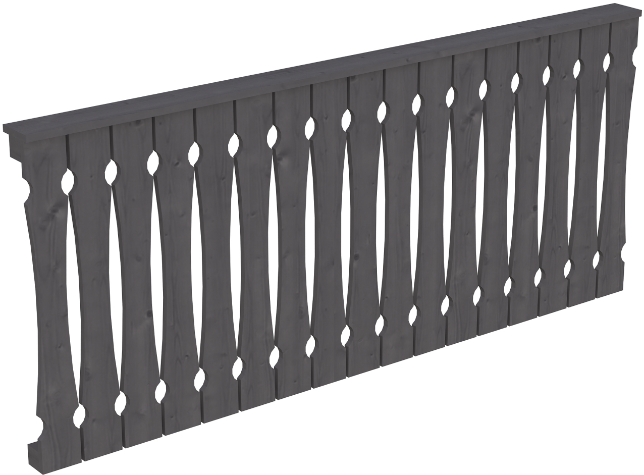
Produktbild AK-Brüstung 220cm