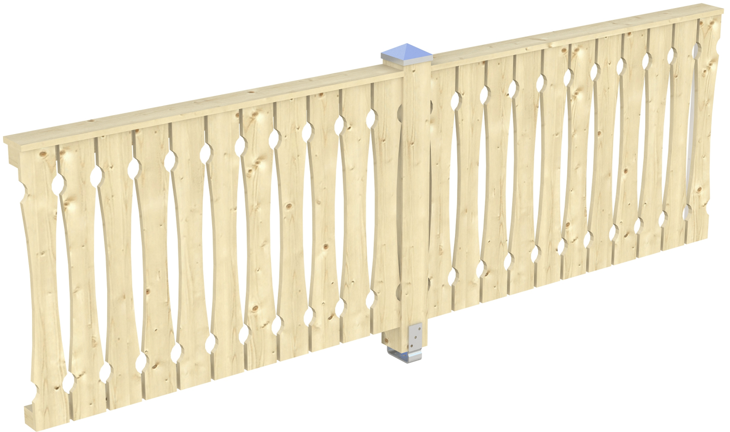
Produktbild AK-Seitenwand 305cm