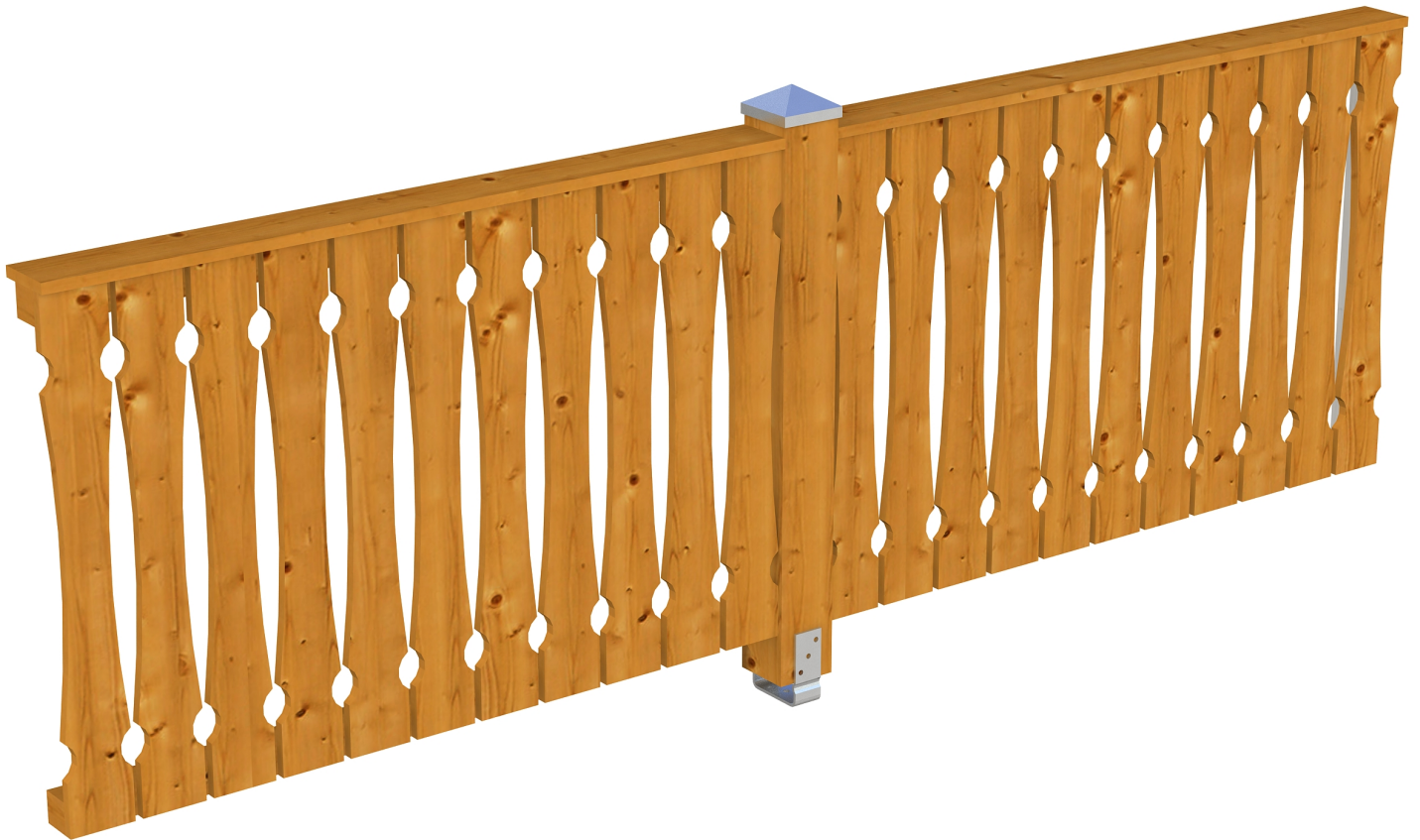
Produktbild AK-Seitenwand 305cm