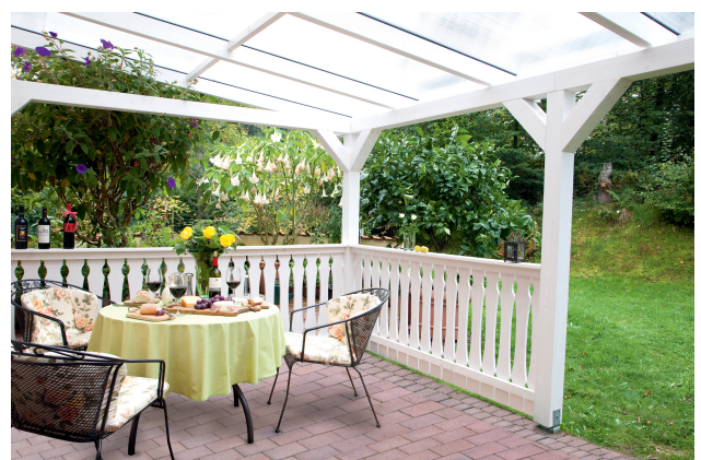
Kundenfoto: Terrassenüberdachung in weiss mit Brüstungen