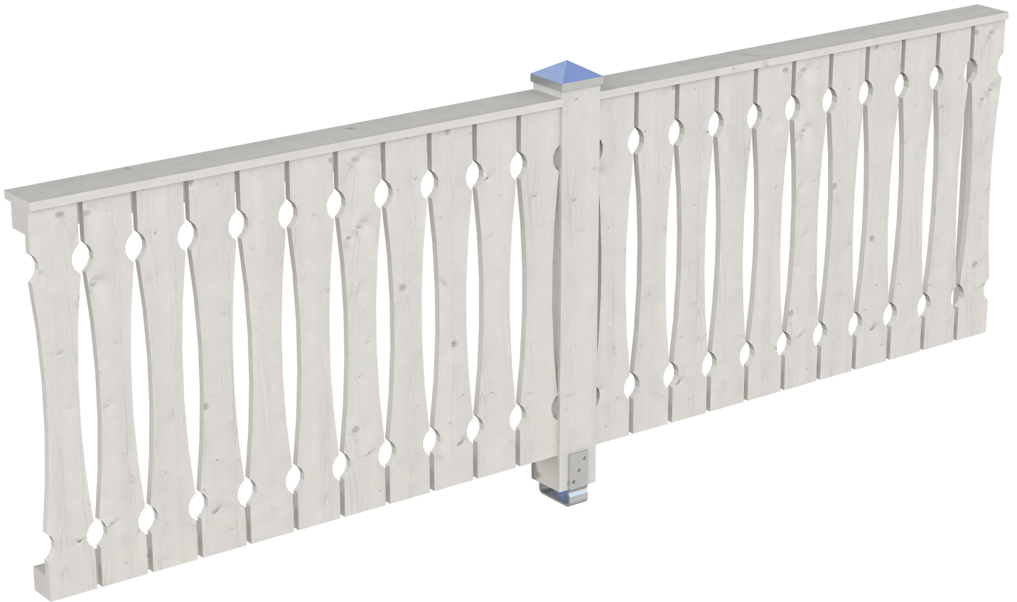
Produktbild AK-Seitenwand 305cm