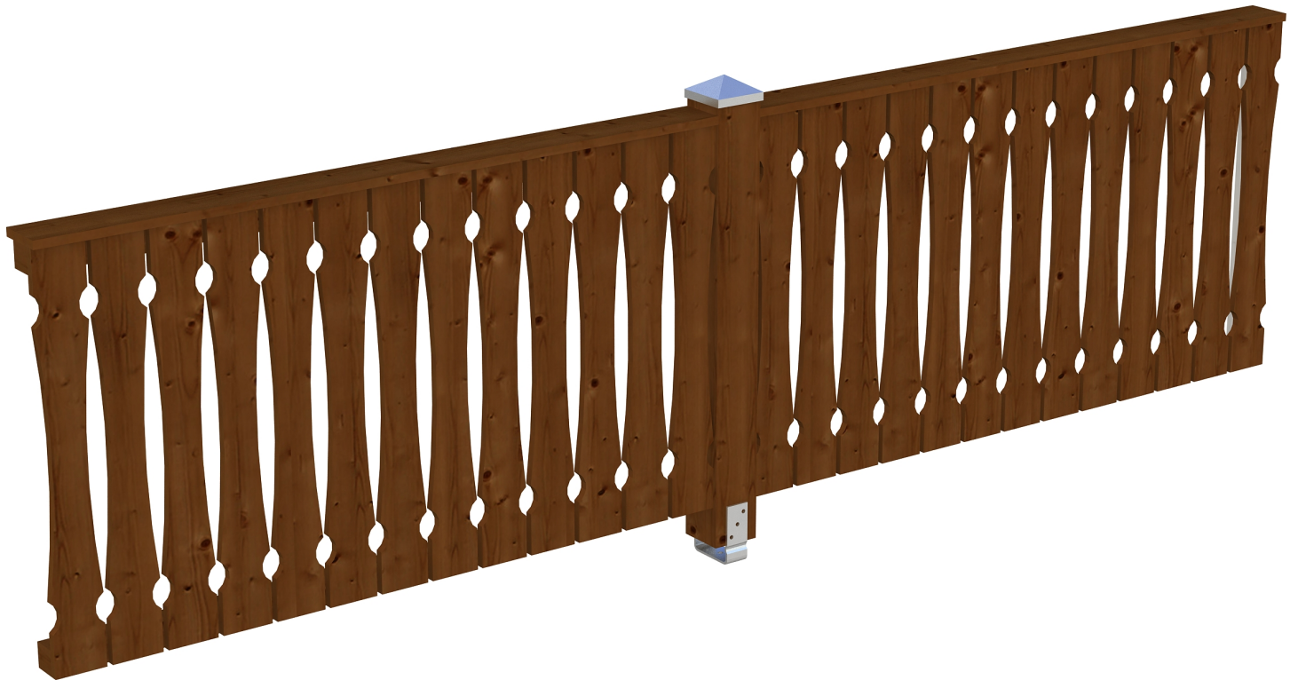
Produktbild AK-Seitenwand 355cm