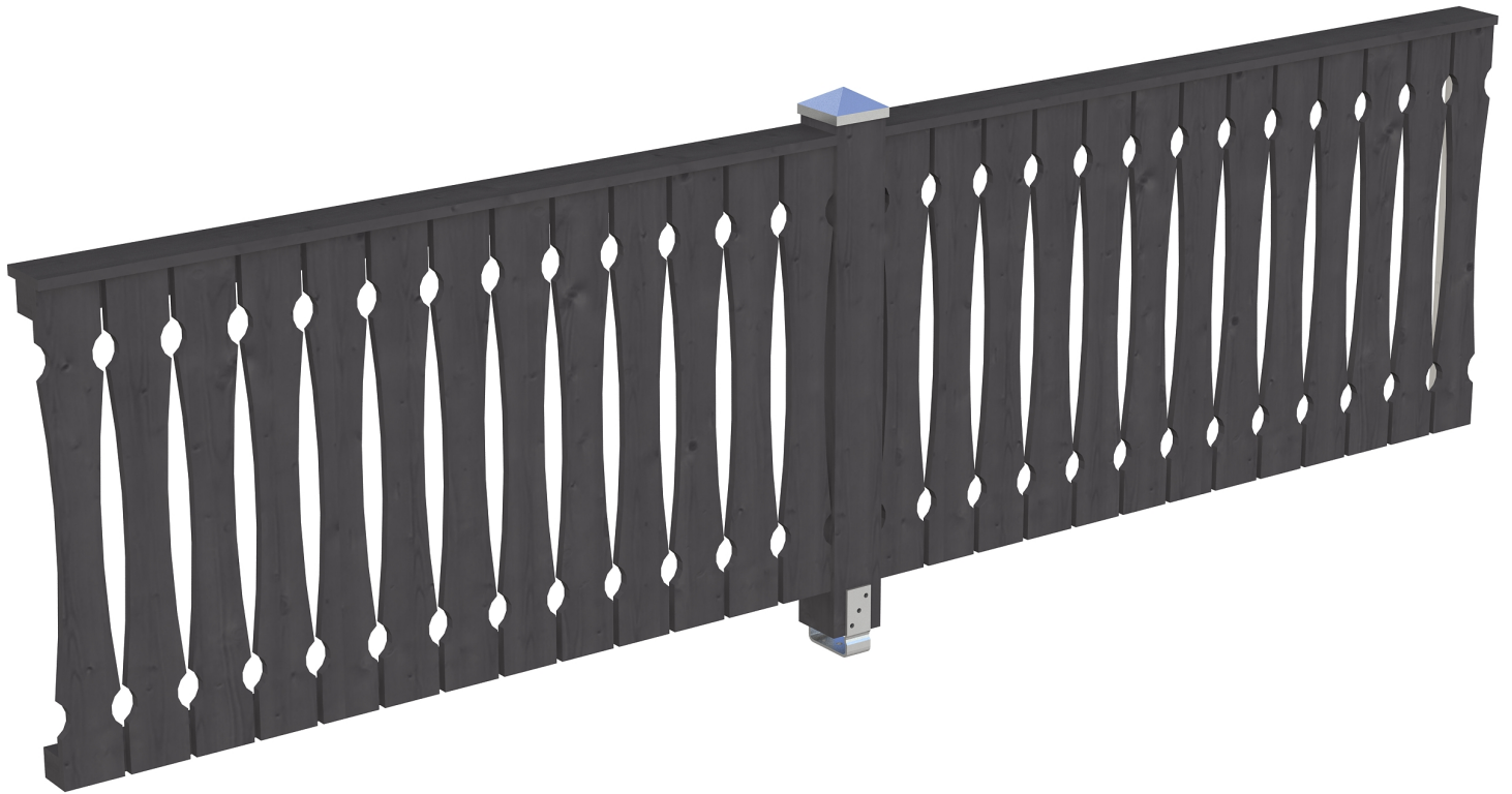
Produktbild AK-Seitenwand 355cm