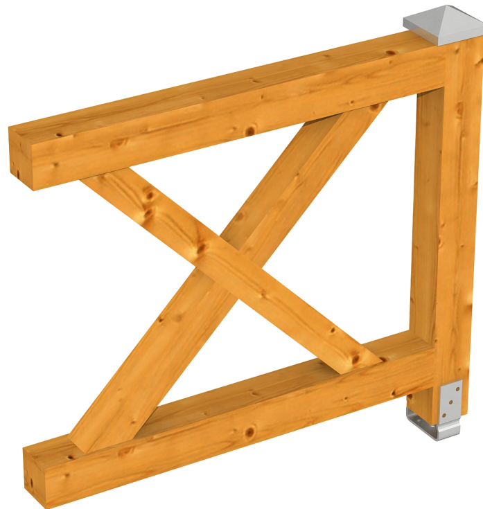
Produktbild AK-Brüstung 108cm