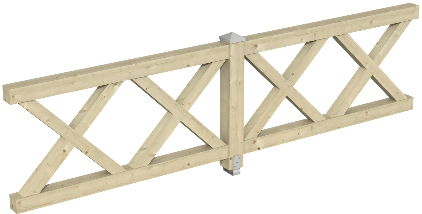
Produktbild AK-Brüstung 335cm