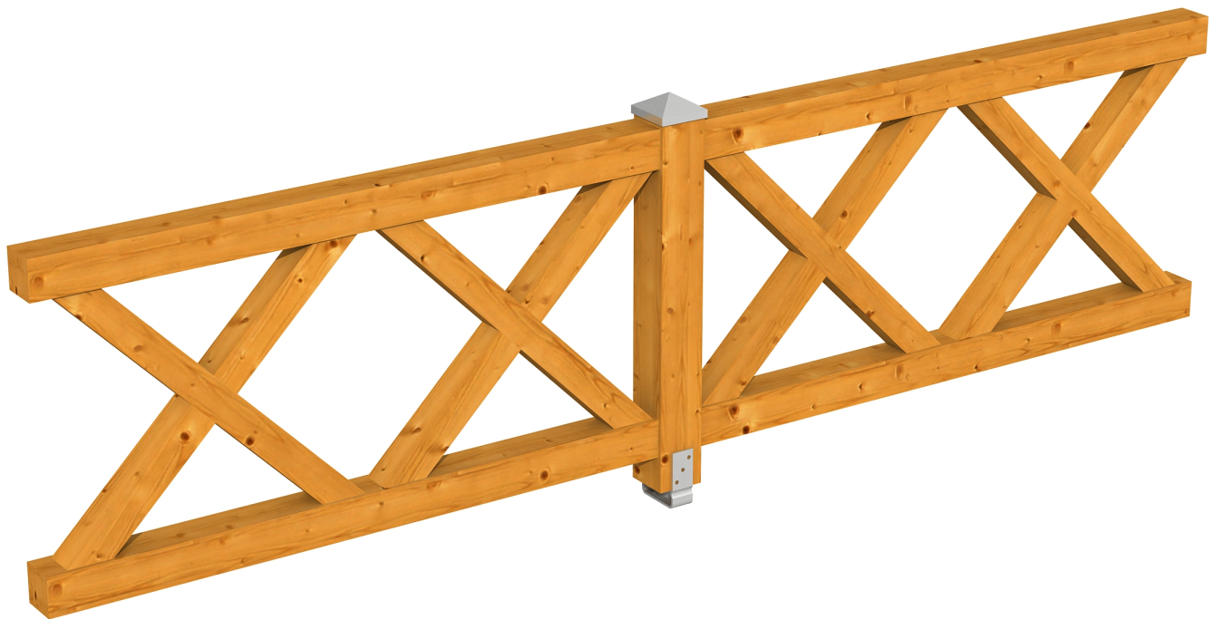
Produktbild AK-Brüstung 335cm