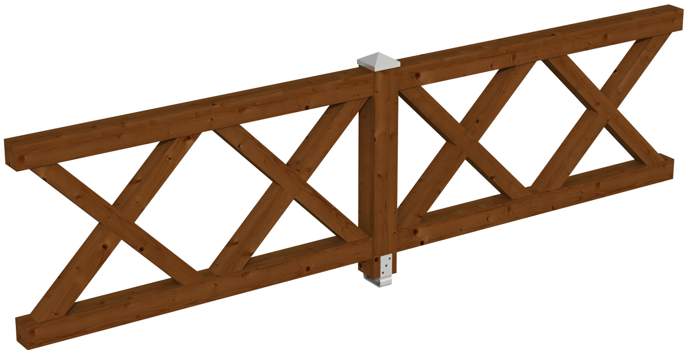
Produktbild AK-Brüstung 335cm