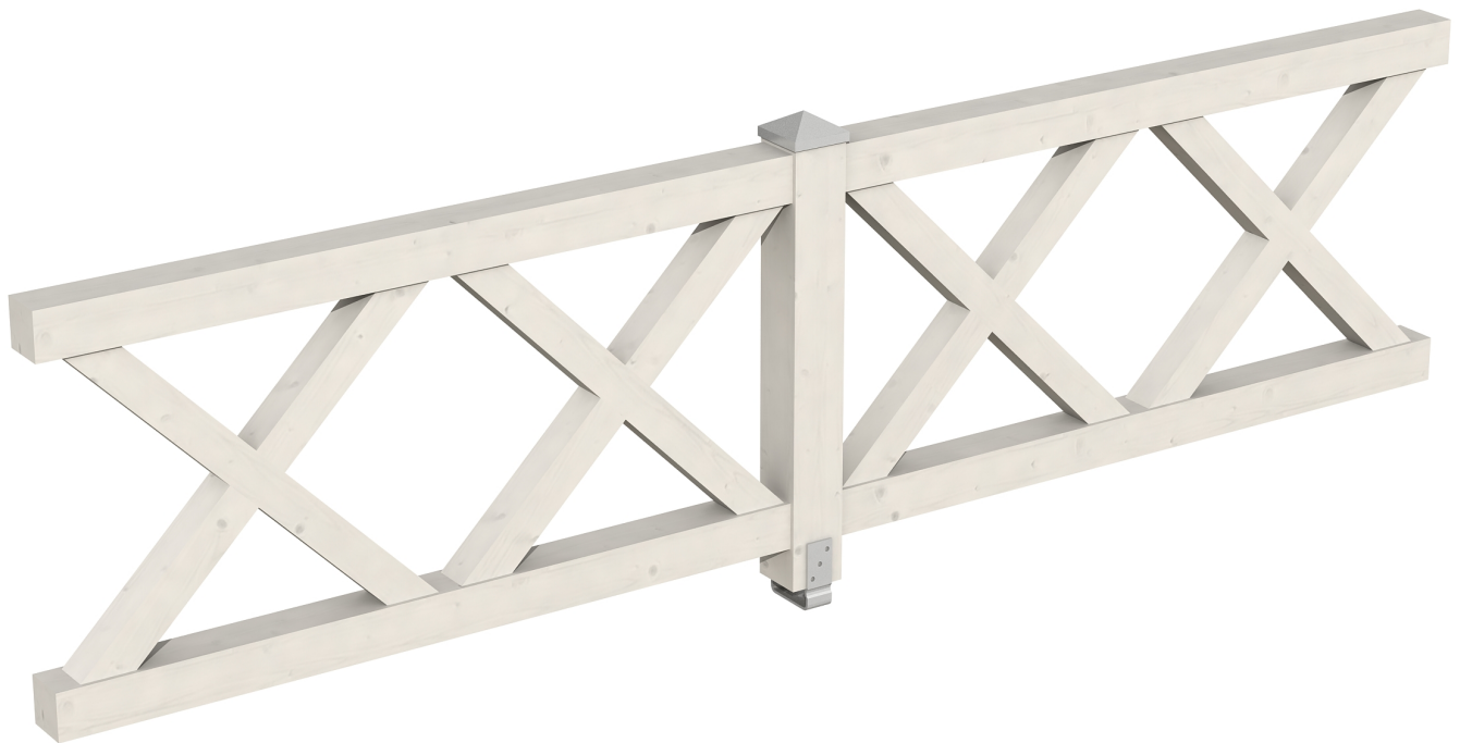
Produktbild AK-Brüstung 335cm