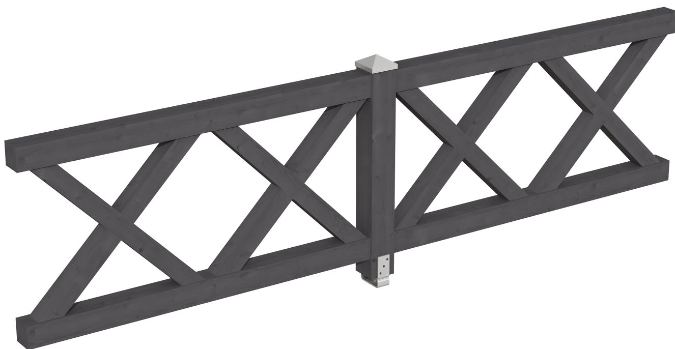
Produktbild AK-Brüstung 335cm