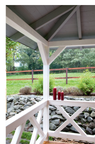
Kundenfoto: Andreaskreuz in weiss