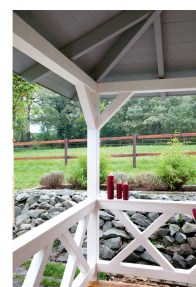
Kundenfoto: Andreaskreuz in weiss