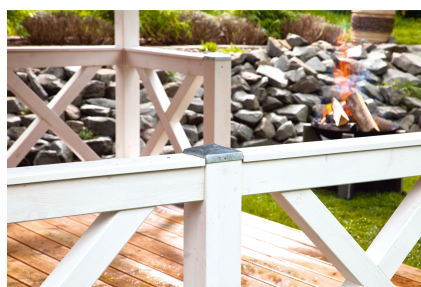
Kundenfoto: Andreaskreuz in weiss