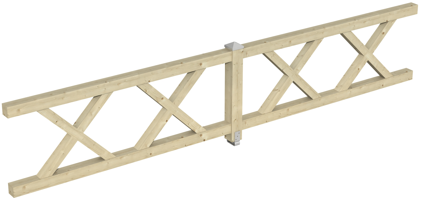
Produktbild AK-Brüstung 465cm