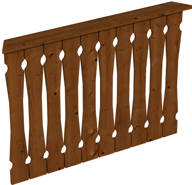
Produktbild Brüstung 120 cm