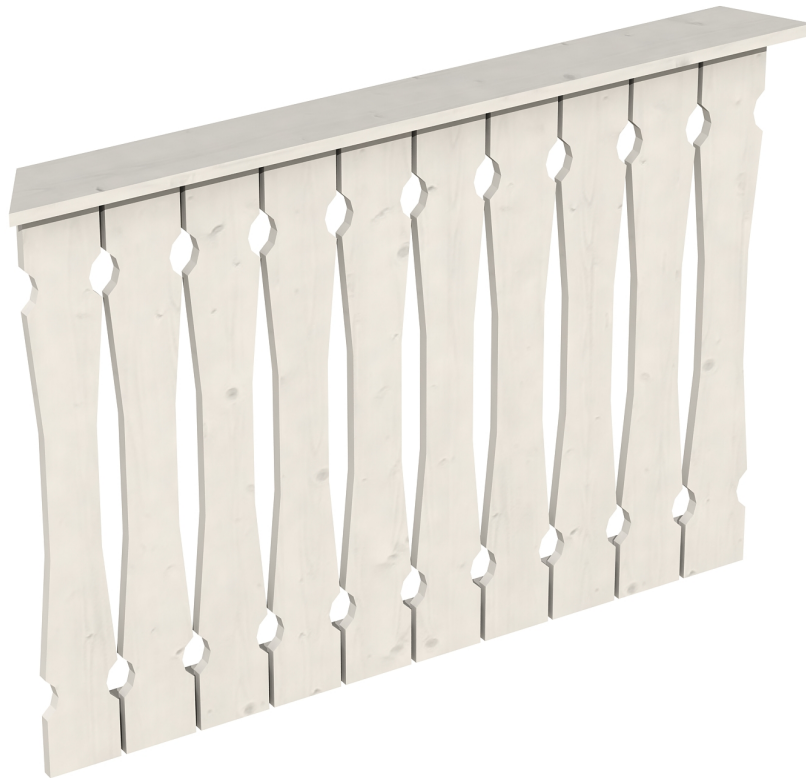
Produktbild Brüstung 120 cm