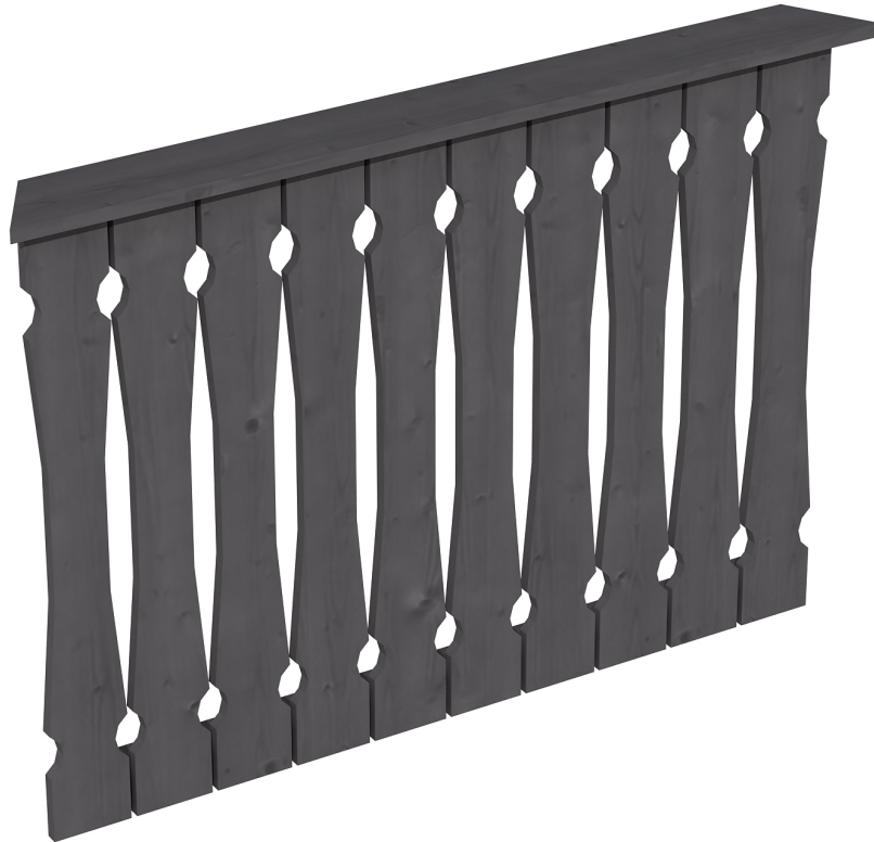
Produktbild Brüstung 120 cm