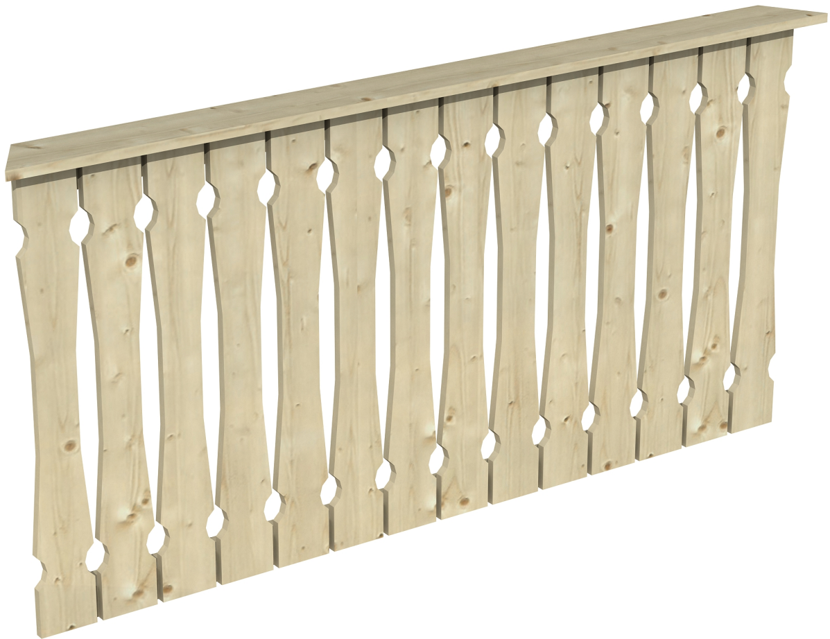
Produktbild Brüstung 180 cm