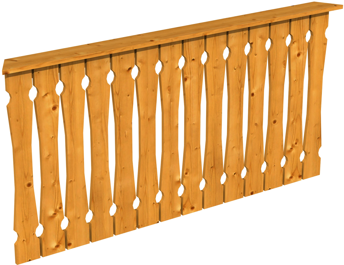
Produktbild Brüstung 180 cm