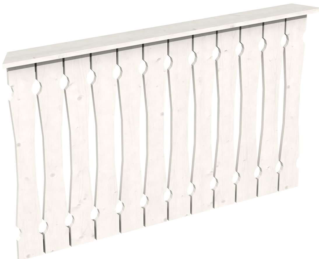
Produktbild Brüstung 150 cm