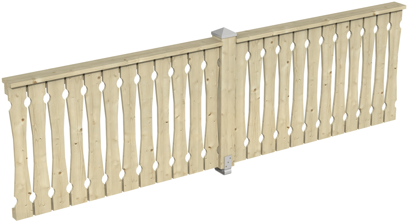
Produktbild Brüstung 335 cm