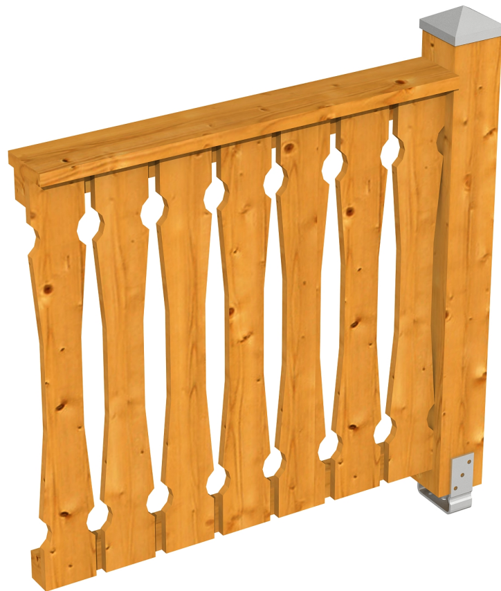
Produktbild Brüstung 108 cm