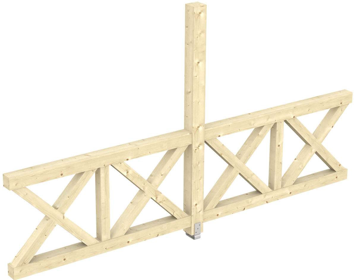
Produktbild AK-Seitenwand 355cm