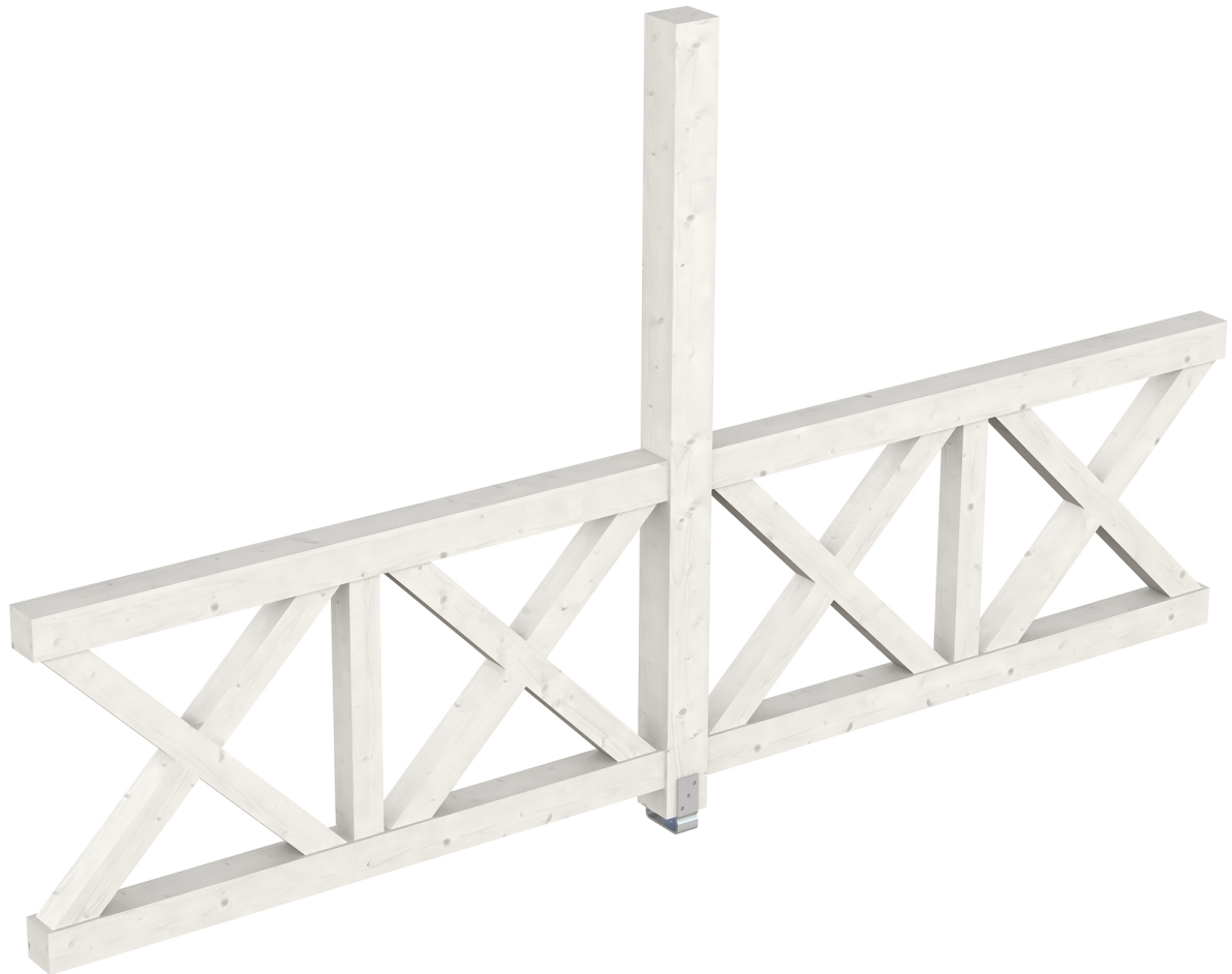
Produktbild AK-Seitenwand 355cm