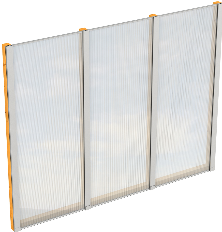
Produktbild Polycarbonat-Seitenwand 255cm