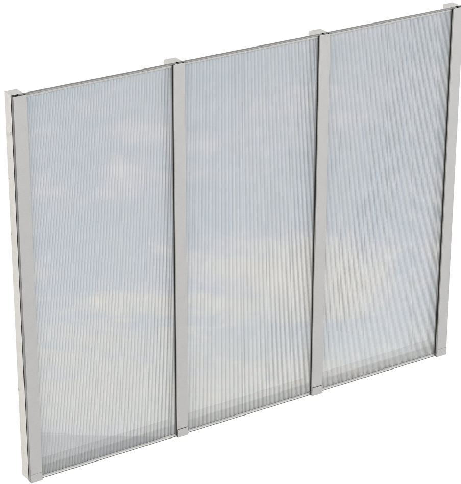
Produktbild Polycarbonat-Seitenwand 255cm