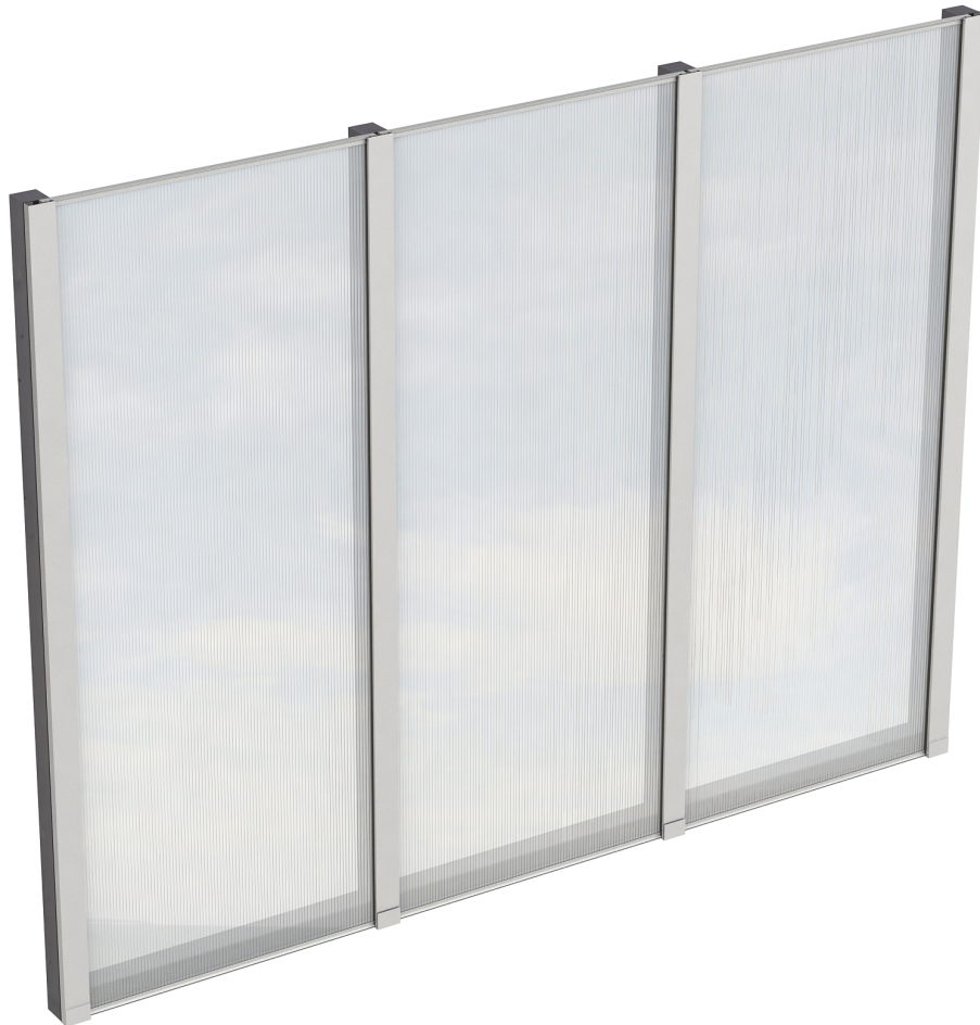
Produktbild Polycarbonat-Seitenwand 255cm