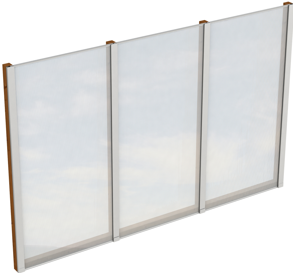
Produktbild Polycarbonat-Seitenwand 305cm