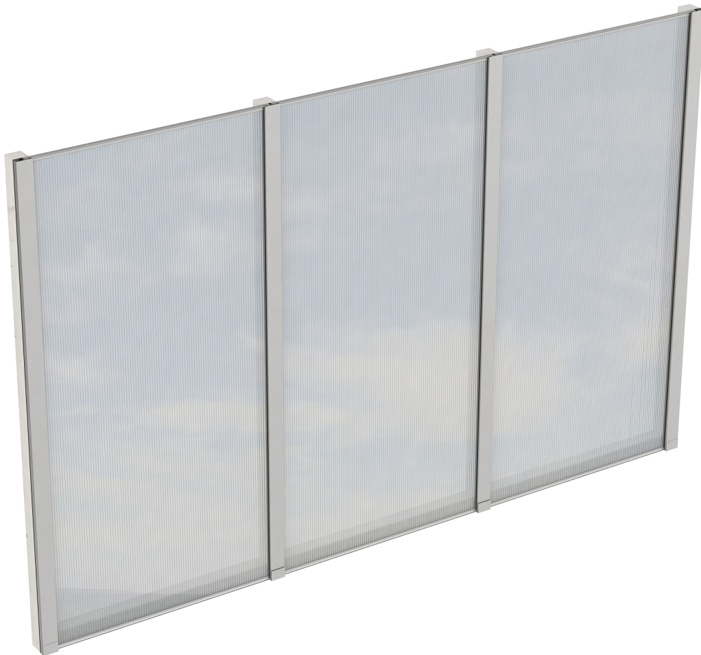
Produktbild Polycarbonat-Seitenwand 305cm