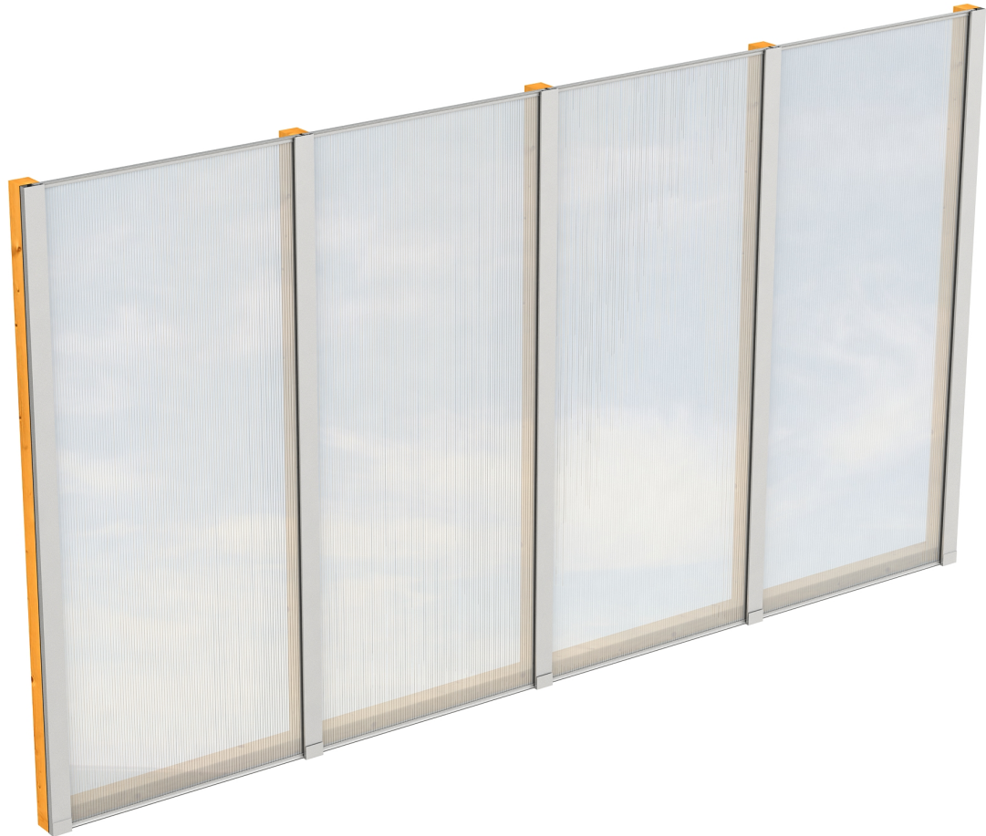
Produktbild Polycarbonat-Seitenwand 355cm