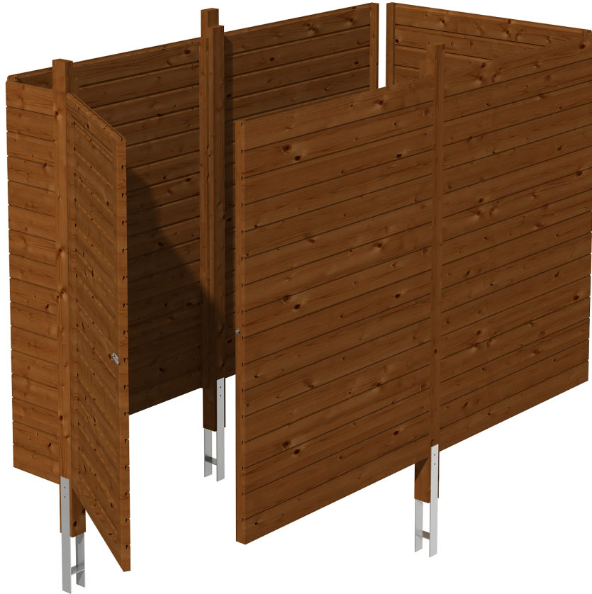
Produktbild Abstellraum C1