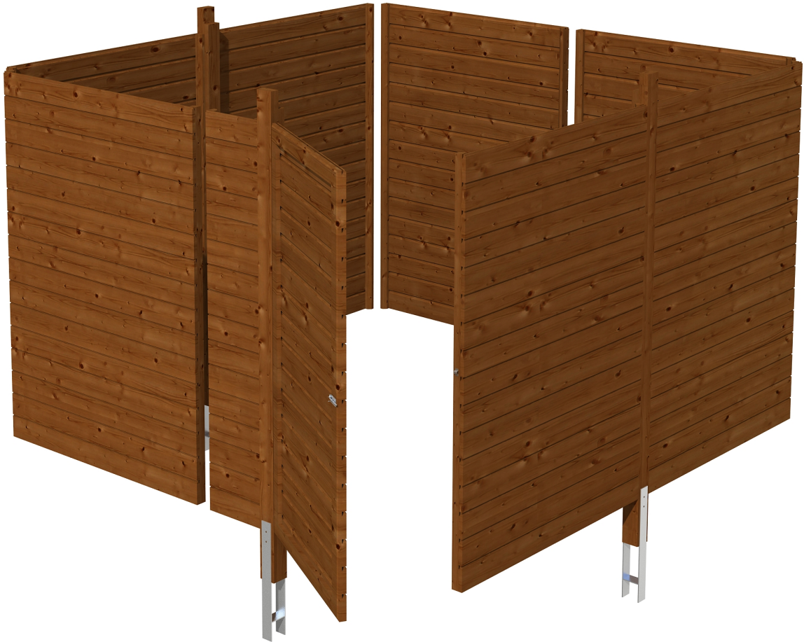
Produktbild Abstellraum C2