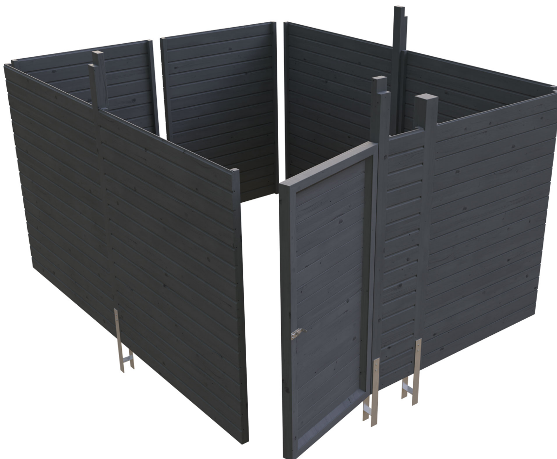
Produktbild Abstellraum C4