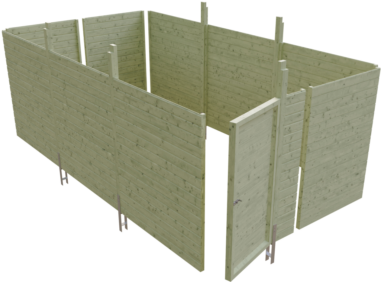
Produktbild Abstellraum C6