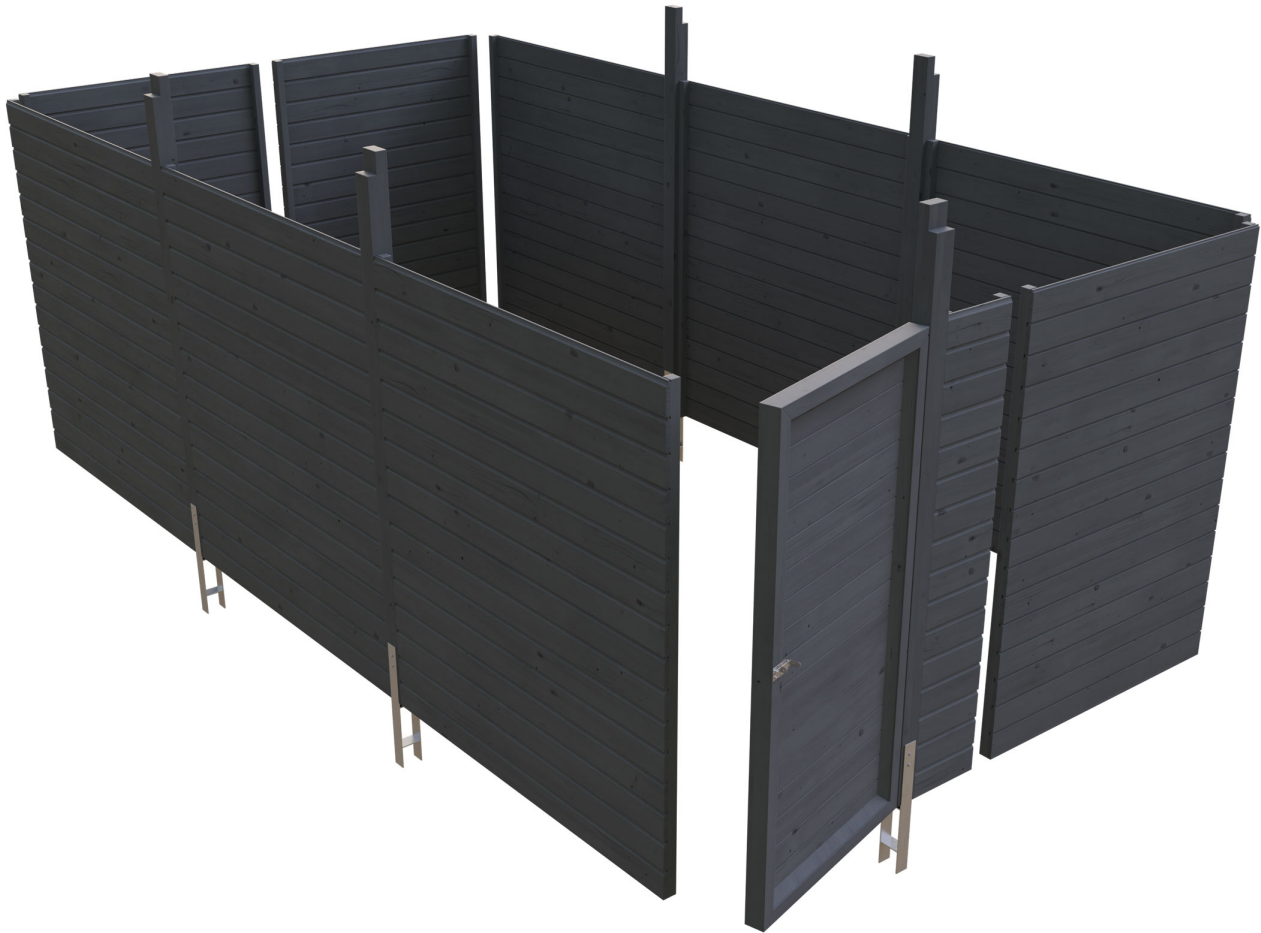
Produktbild Abstellraum C6