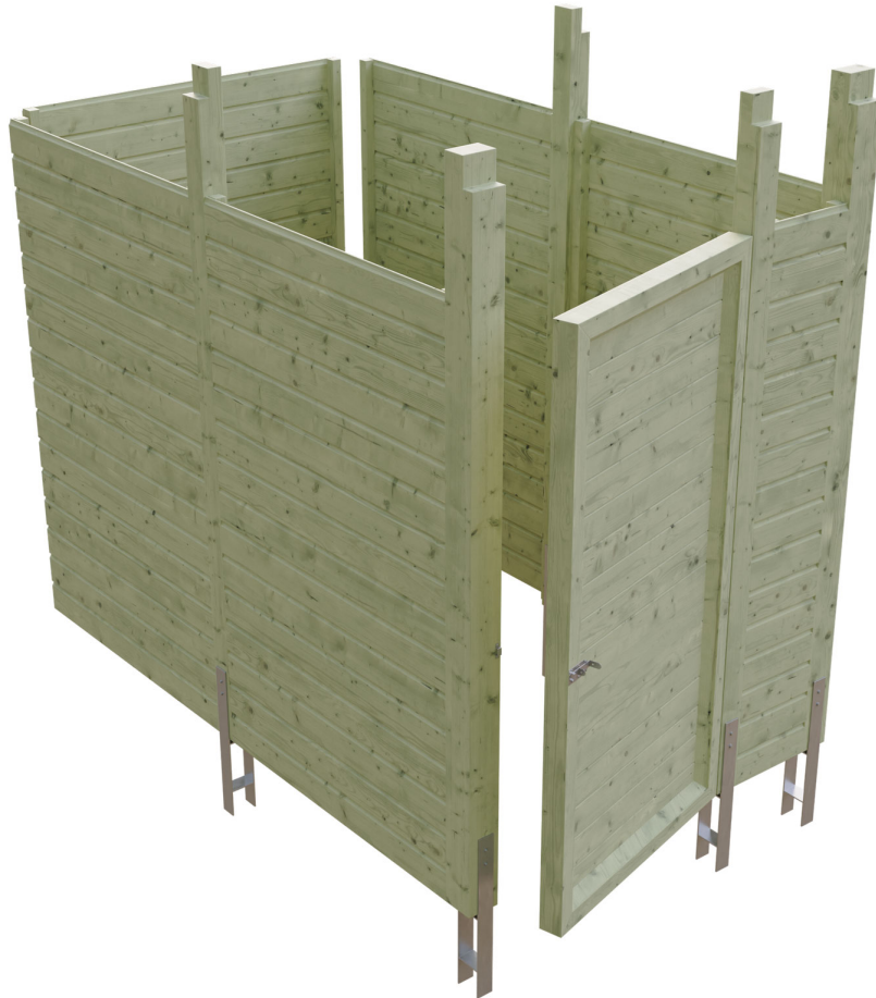
Produktbild Abstellraum C7