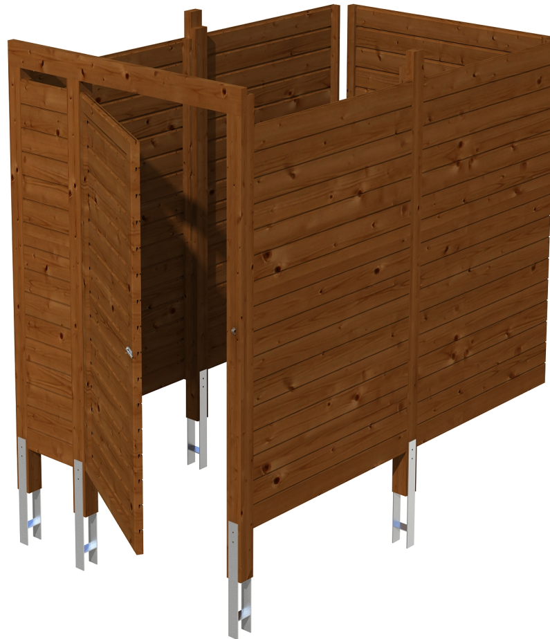
Produktbild Abstellraum C7