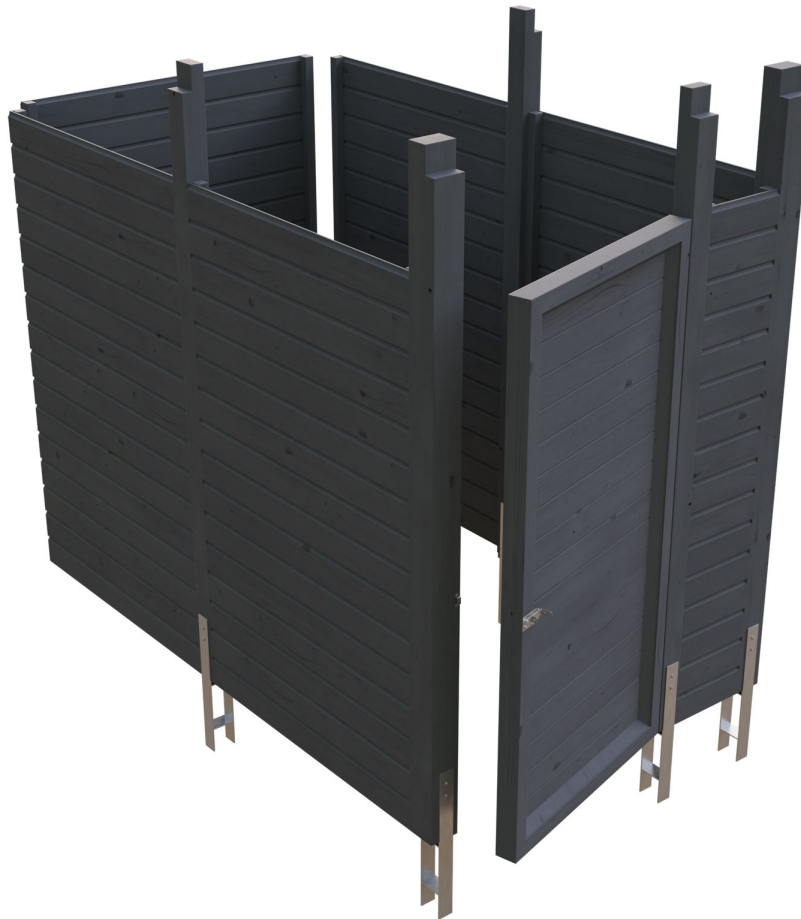
Produktbild Abstellraum C7