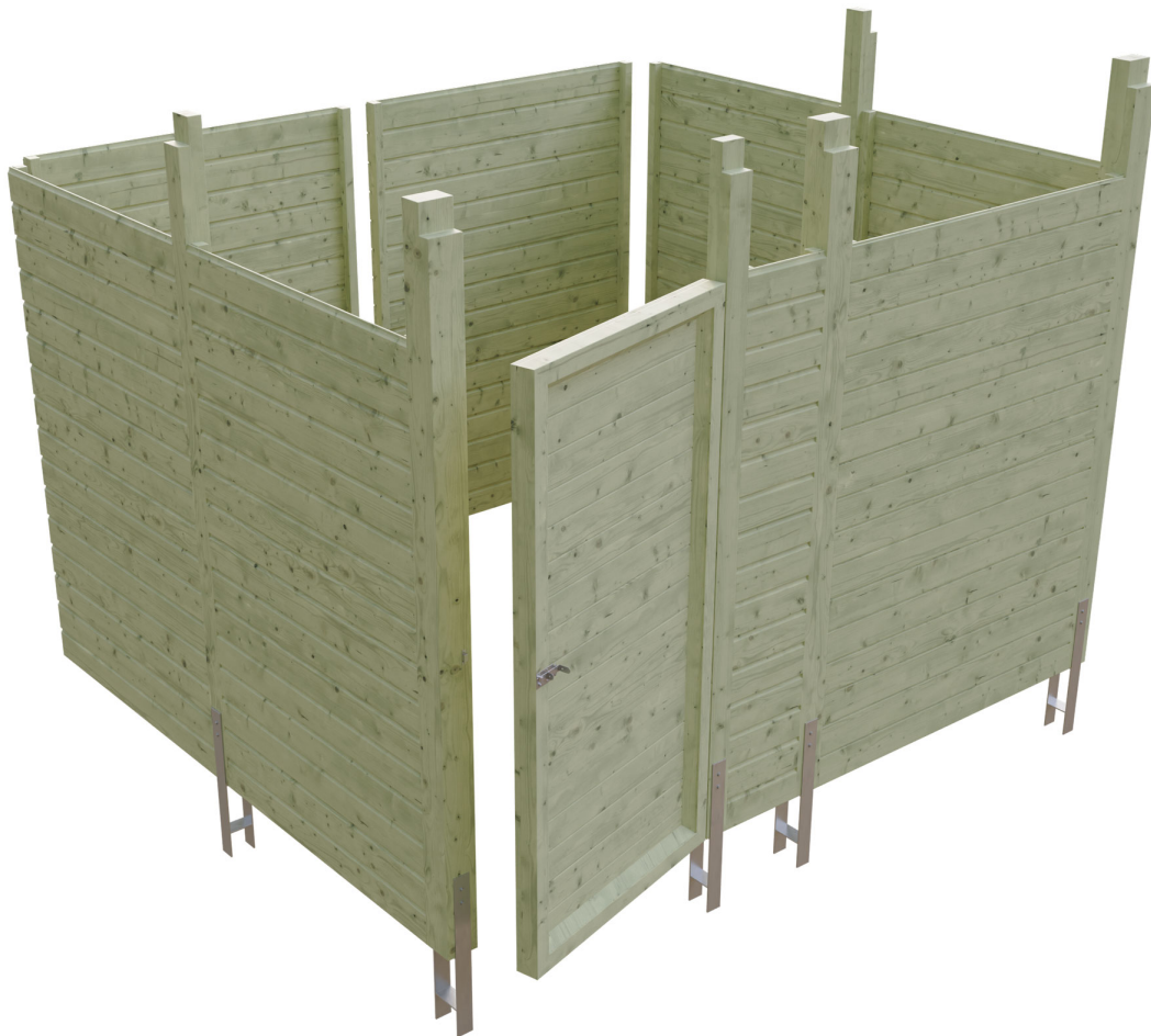
Produktbild Abstellraum C8