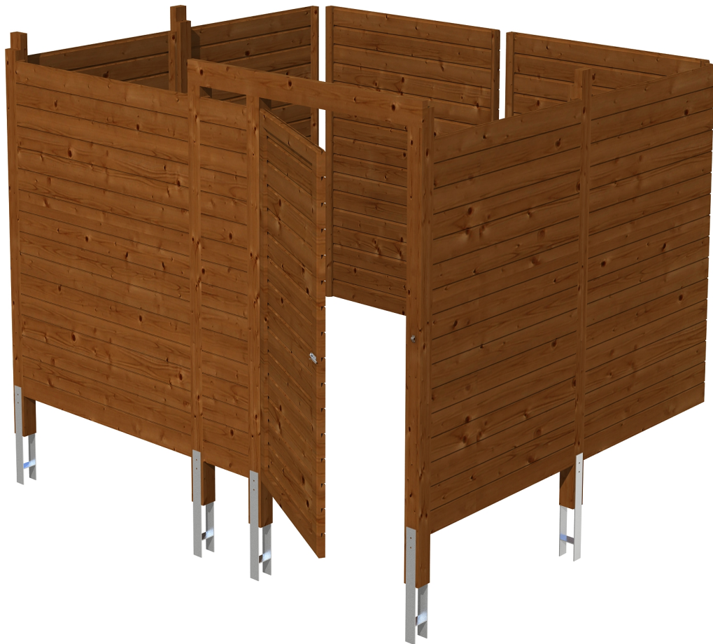
Produktbild Abstellraum C8