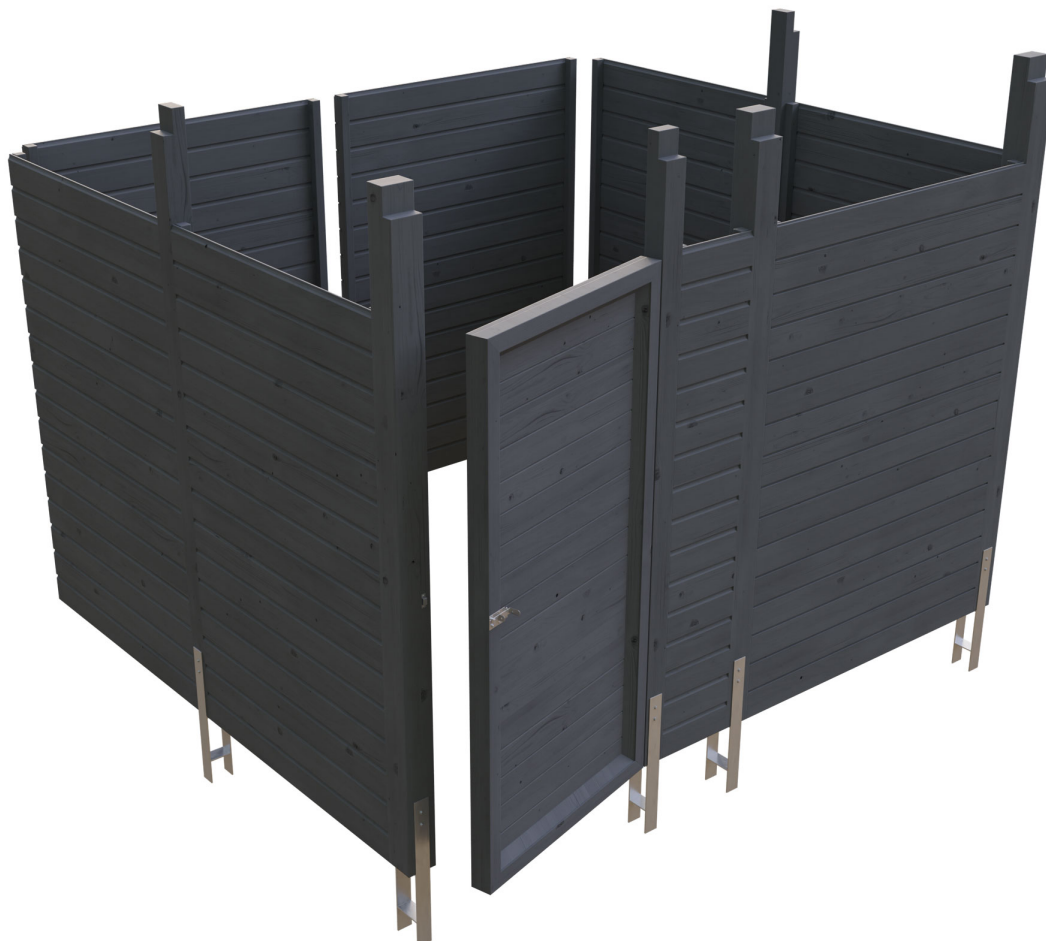
Produktbild Abstellraum C8