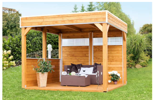
Kundenfoto: Pavillon mit Zubehör