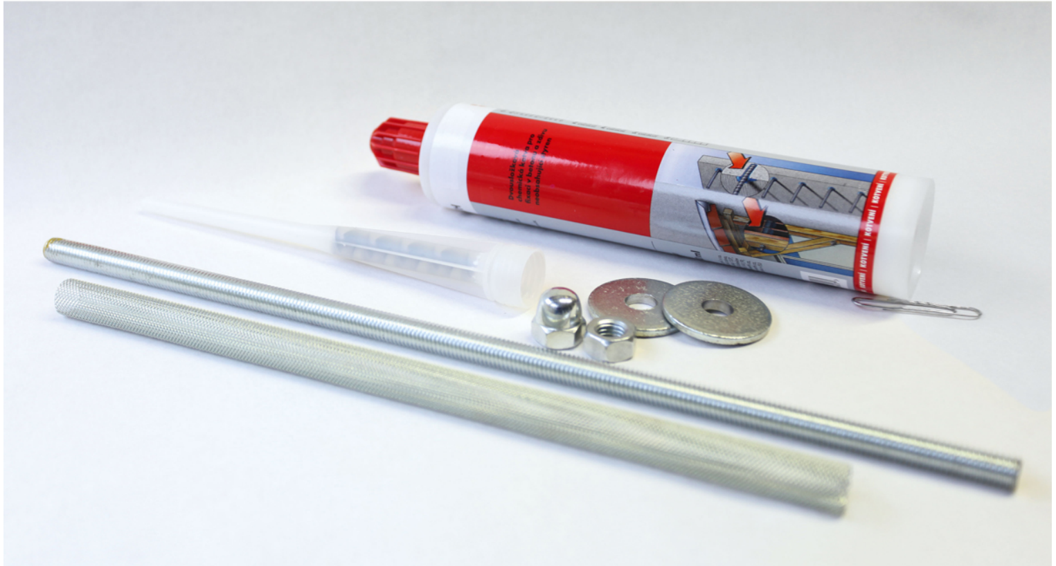
Materialien vom Wandbefestigungsset