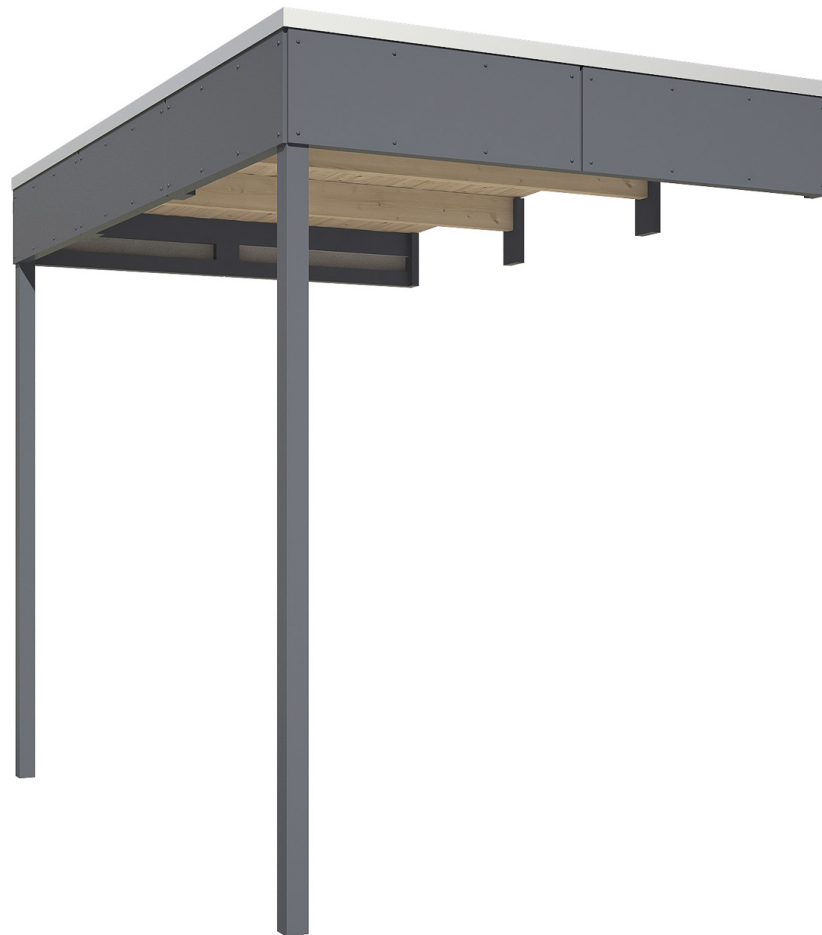
Produktbild Seitliche Überdachung