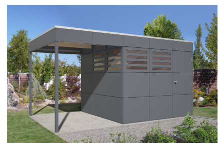
Seitliche Überdachung mit Haus