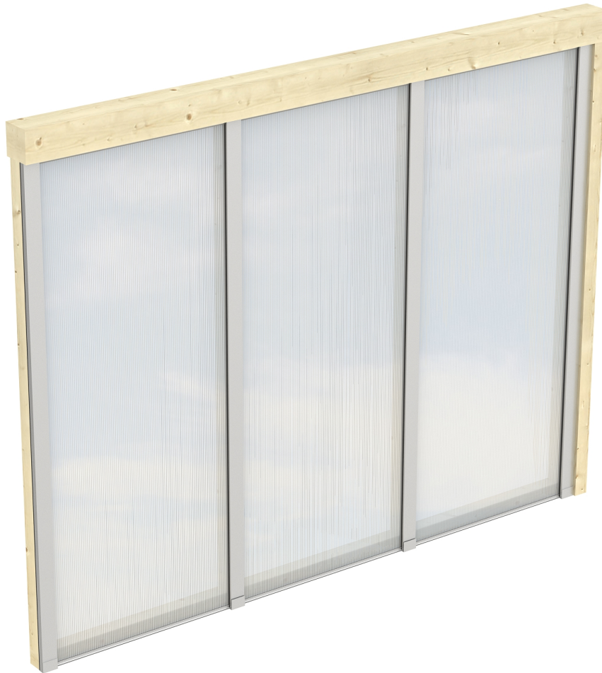
Produktbild Polycarbonat-Seitenwand 255cm