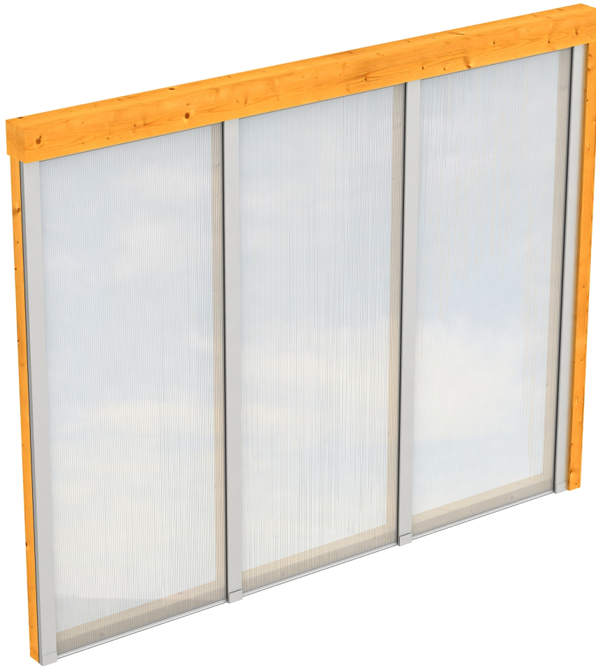
Produktbild Polycarbonat-Seitenwand 255cm