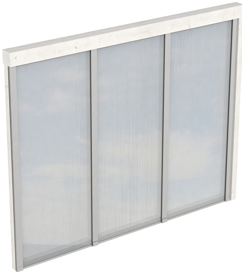
Produktbild Polycarbonat-Seitenwand 255cm