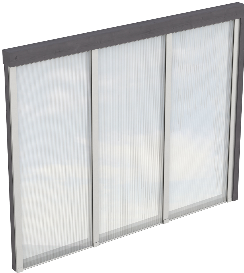
Produktbild Polycarbonat-Seitenwand 255cm