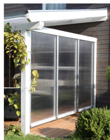
Kundenfoto: Terrassenüberdachung weiss mit Seitenwand Polycarbonat