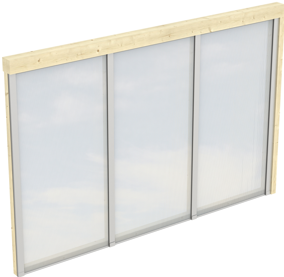
Produktbild Polycarbonat-Seitenwand 305cm