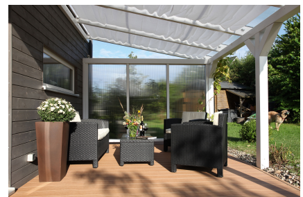
Kundenfoto: Terrassenüberdachung weiss mit Seitenwand Polycarbonat