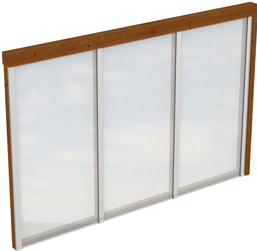
Produktbild Polycarbonat-Seitenwand 305cm